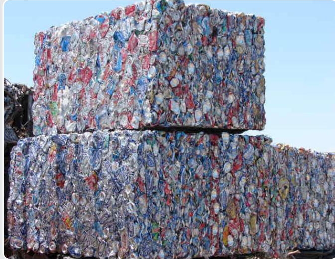
الجدول (1) خدمات إدارة النفايات:

https://www.pakawaste.co.uk/the-benefits-of-balers/